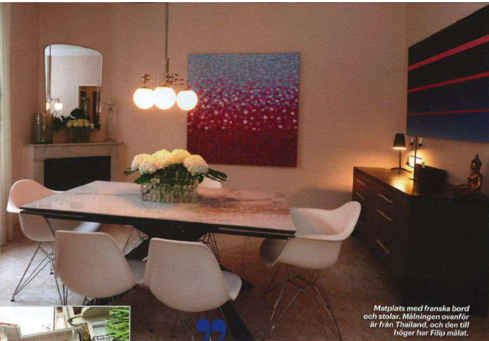
Matplats med franska bord och stolar. Målningen ovanför är från Thailand, och den till höger har Filip målat.